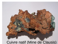
Cuivre natif (Mine de Clausis)

Fin de stage et dispersion dans l'après-midi