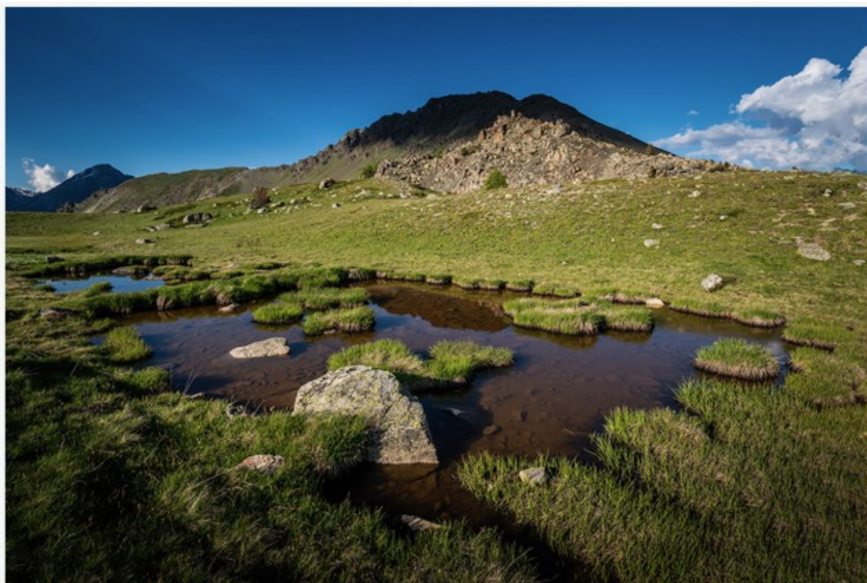
Le massif du CHENAILLET