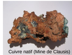
Cuivre natif (Mine de Clausis)

Fin de stage et dispersion dans l'après-midi