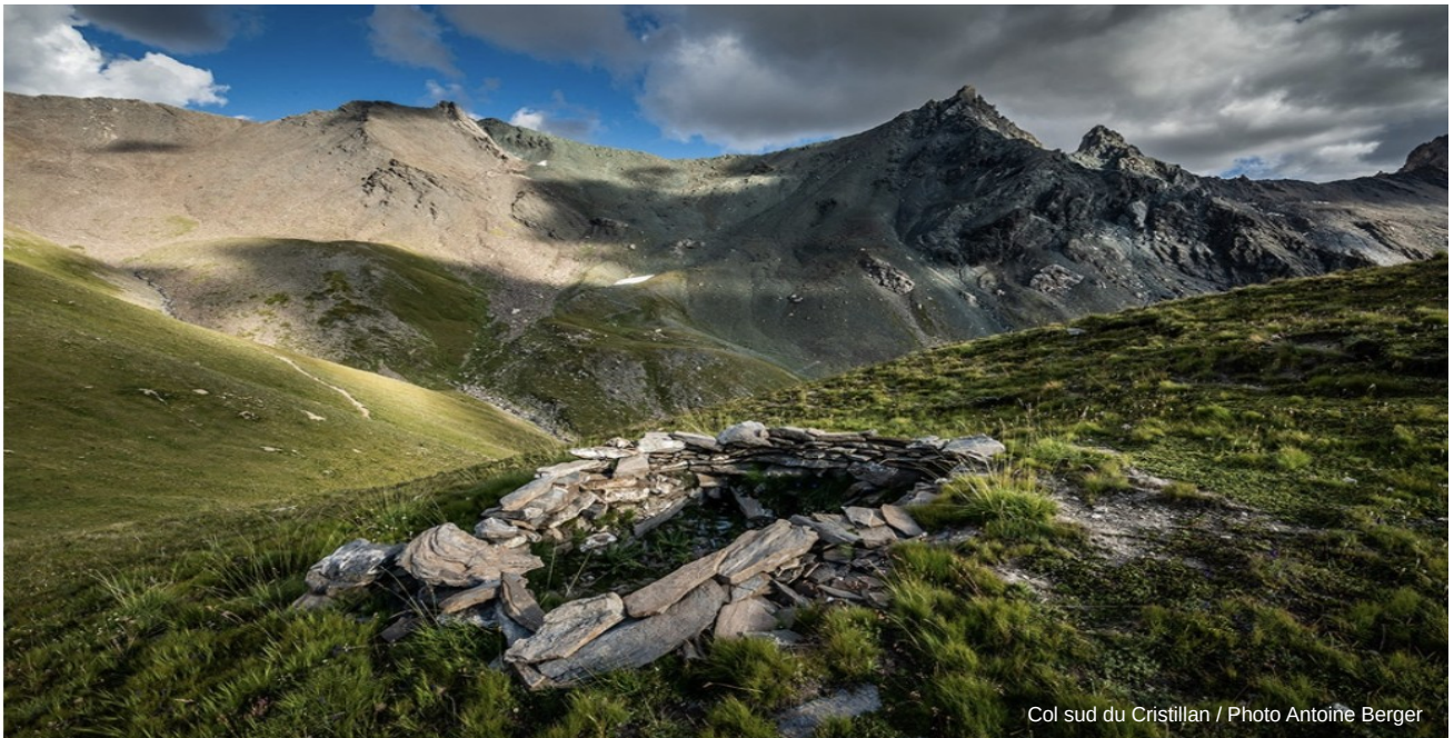
Col sud du Cristillan

Au cours de ces quatre journées de randonnées géologiques au cœur des Alpes nous partirons à la découverte d'un ancien océan, l'océan alpin, qui a vu le jour au Jurassique, il y a environ 180 millions d'années. Les ophiolites, cette association de roches caractéristiques d'un fragment de lithosphère océanique, seront le fil conducteur qui nous guidera sur les traces de cet océan. Nous constaterons aussi le lien étroit qu'elles entretiennent avec la présence de ressources minérales anciennement exploitées (amiante, cuivre, marbre vert).